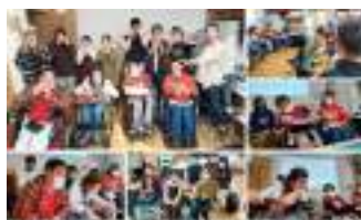
新人スタッフ研修 ～自立生活運動部門編～