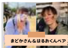
まどかさん&はるあくんペア