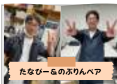
たなびー&のぶりんペア