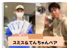
スミス&てんちゃんペア