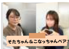
そたちちゃん&こなっちゃんペア