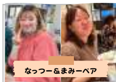
なっつー&まみーペア