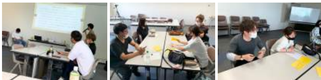
↑研修を受けグループワークを行う様子

第1回目は5月。「差別ってなあに」をテーマに、日常の中にある「これは、差別か？」という事例を挙げて「これは差別？差別じゃない？」を考えてもらい、それが差別だった場合はどうすれば解消されるかをグループで考えてもらいました。