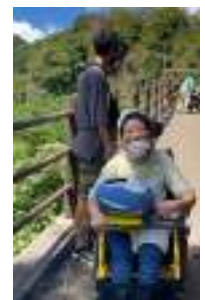
パイオニアメンバーで箕面大滝へ観光