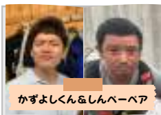
かずよし&しんぺーペア